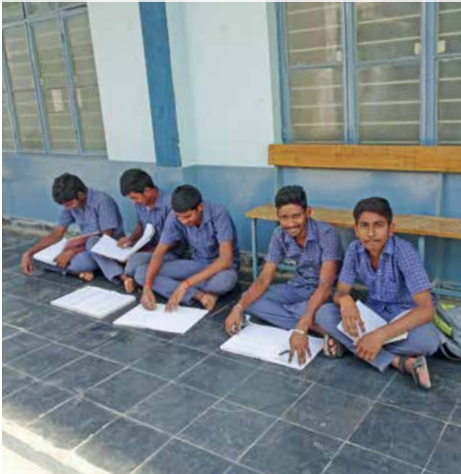
Junge Menschen lernen mit Freude.

Einst perspektivlose Schulabbrecher, Waisen und Straßenkinder aus ärmsten Verhältnissen finden hier und im ordenseigenen Wohnheim Halt und Zuversicht. Mehrere tausend junge Menschen haben ihre Ausbildung bereits erfolgreich abgeschlossen und sind nun in der Lage, sich selbst zu versorgen.