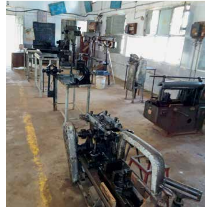
Die Maschinen sind marode und nicht mehr einsetzbar.